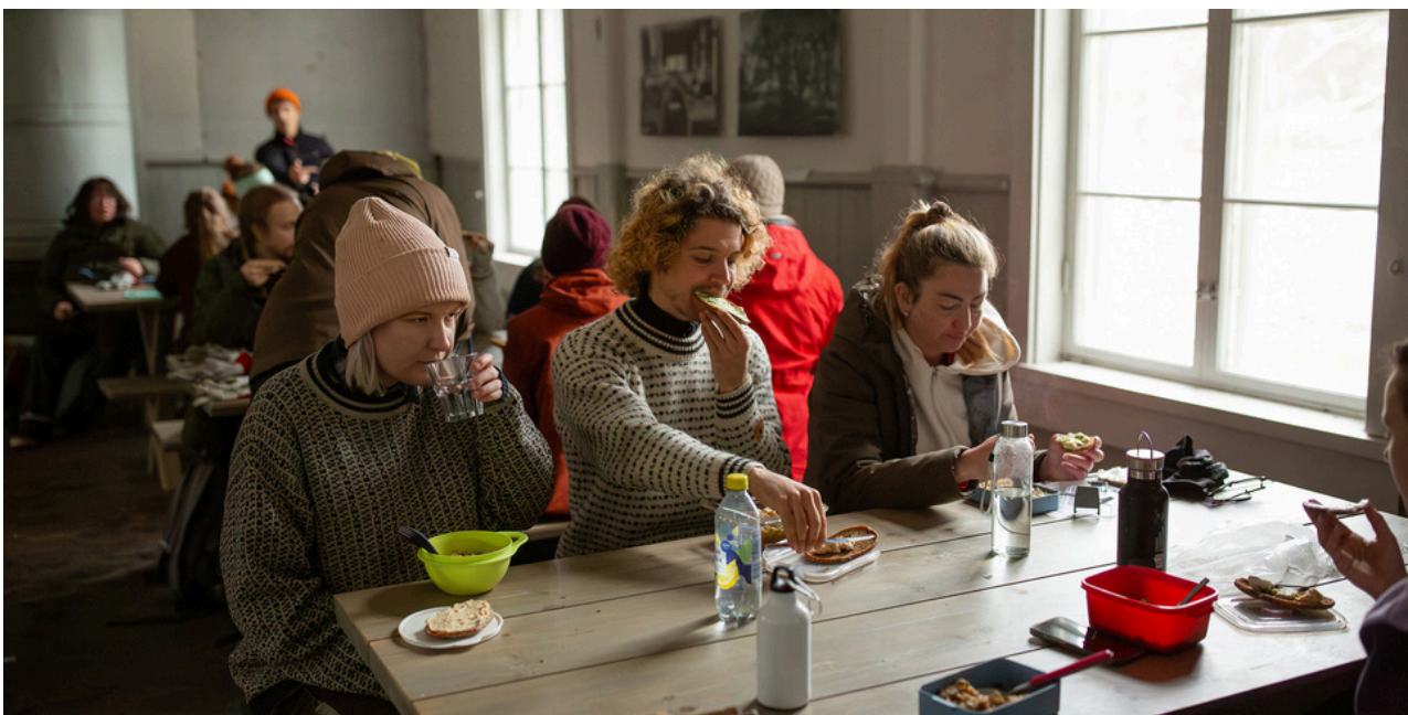
Finland, 2024