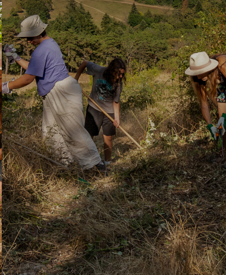
Kamp georganiseerd door Stromzivota in een weide-ecosysteem in Slowakije, 2024