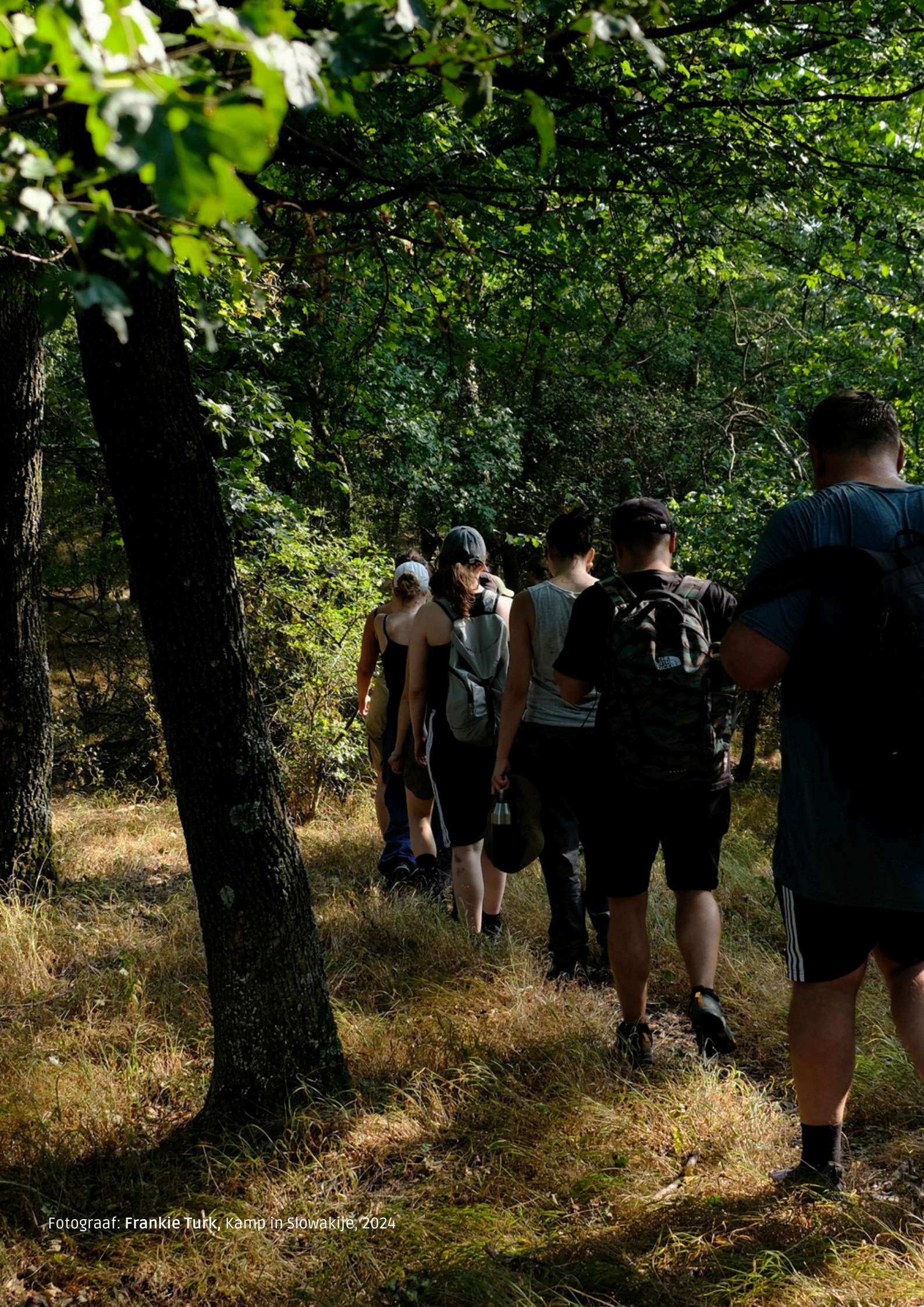
Fotograaf: Frankie Turk, Kamp in Slowakije, 2024