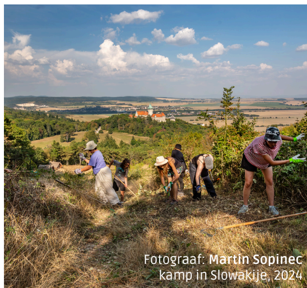
Kamp in Slowakije, 2024