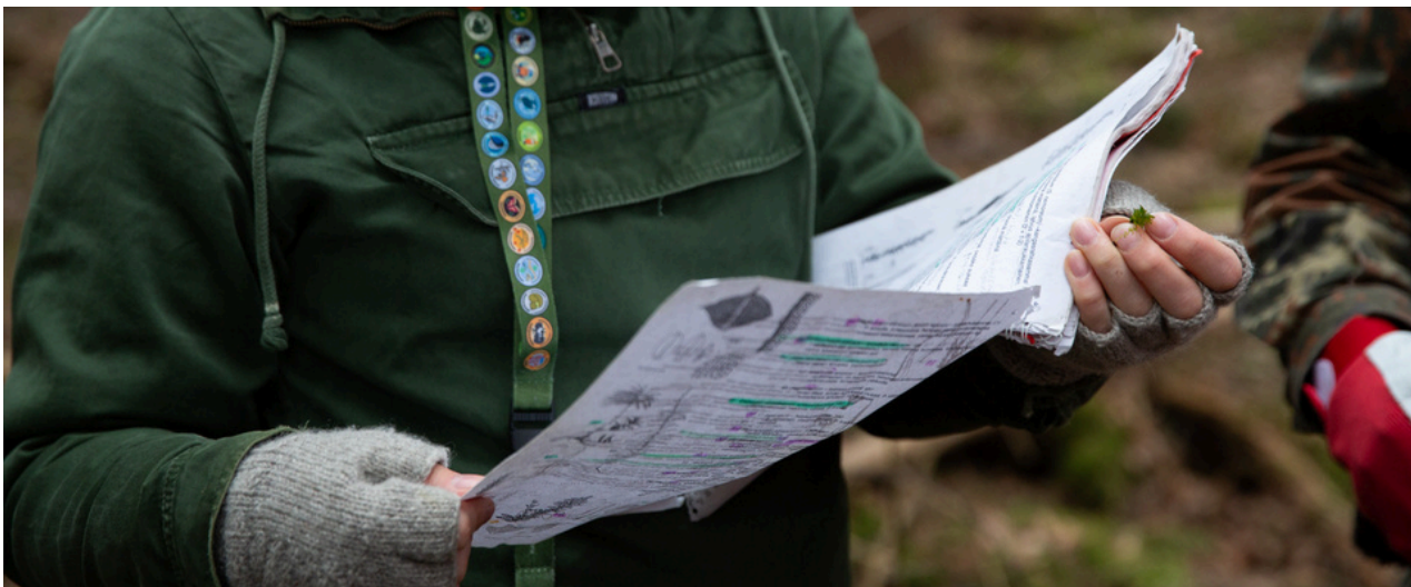
Fotograaf: Aino Huotari, Finland, 2024