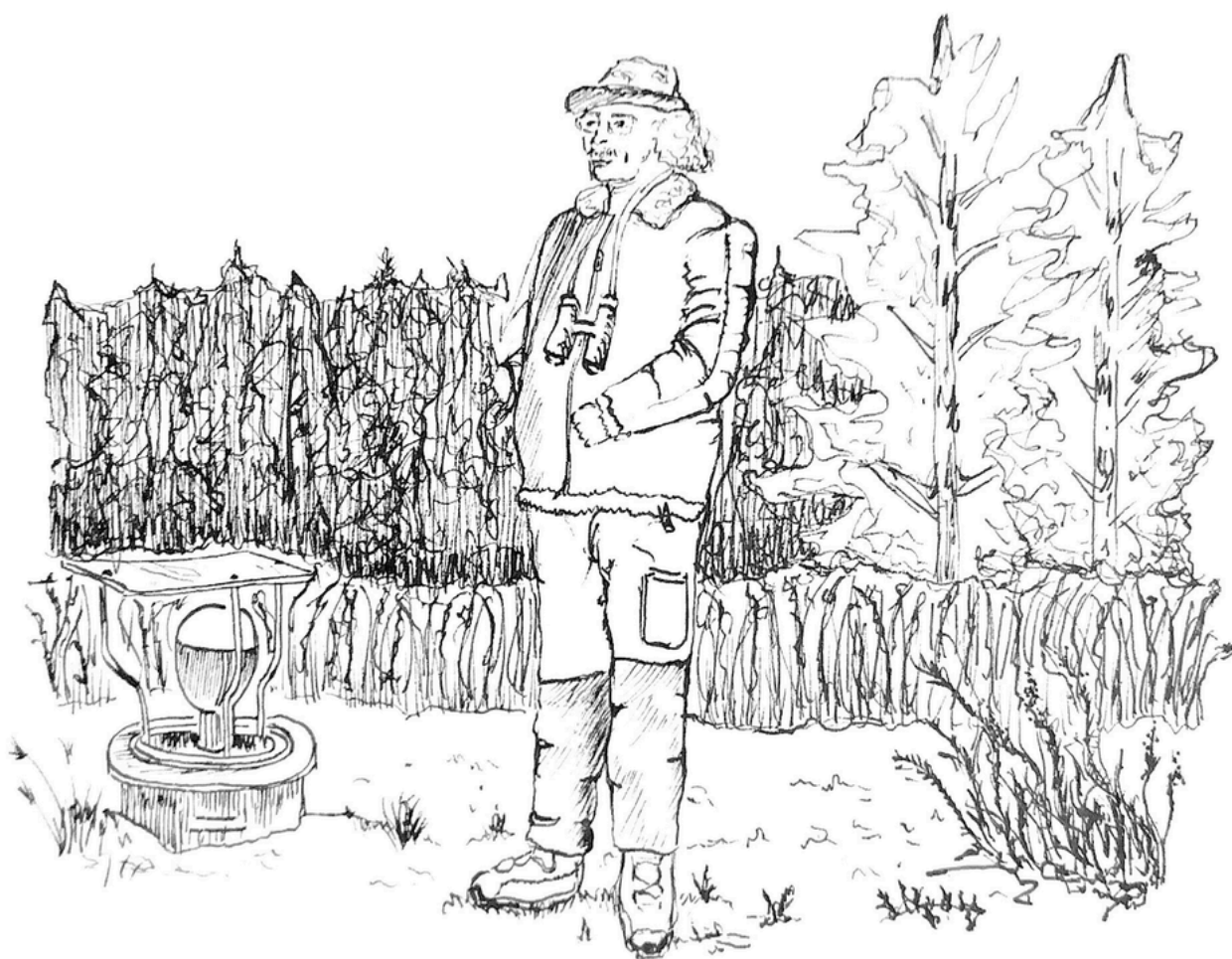
Observatietekeningen door Holly Bartley tijdens het Finse restauratiekamp.