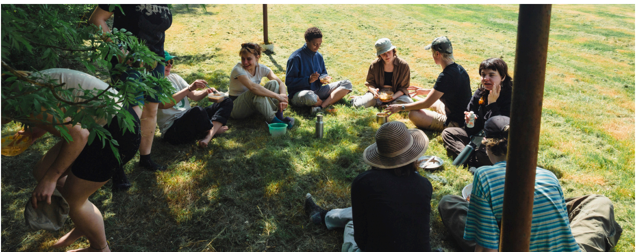
Kamp in Nederland, 2025

Wij adviseren om de dag af te sluiten met een dagreflectie. Dit kan een kort groeps gesprek zijn of een individuele schrijfofdracht. Het is een moment om te delen wat we hebben geleerd, hoe de dag voelde en wat er kan worden verbeterd. Deze reflectie versterkt het leerproces en draagt bij aan een hechtere groepservaring.