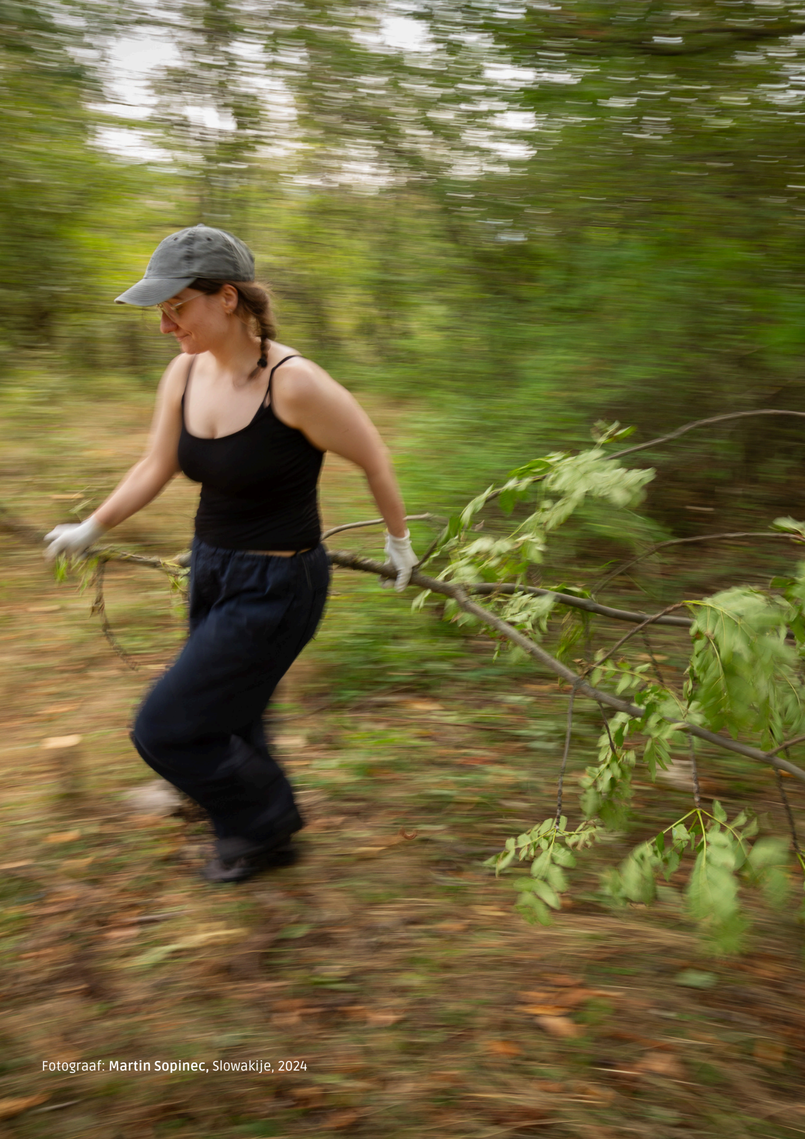
Fotograaf: Martin Sopinec, Slowakije, 2024