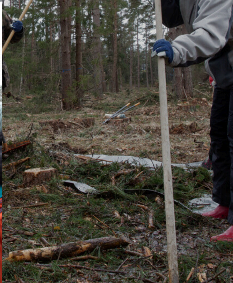
Kamp georganiseerd door Luontoliitto en Nuorten Akatemia op Öro en Norstö eilanden in Finland, 2024