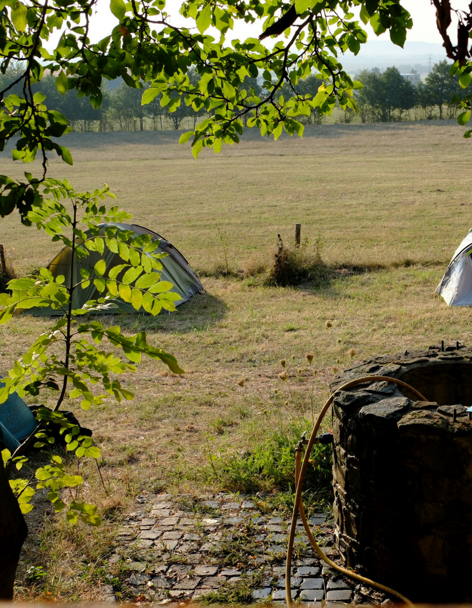
Tijdens het kamp georganiseerd door Strom Života in Slowakije, 2024