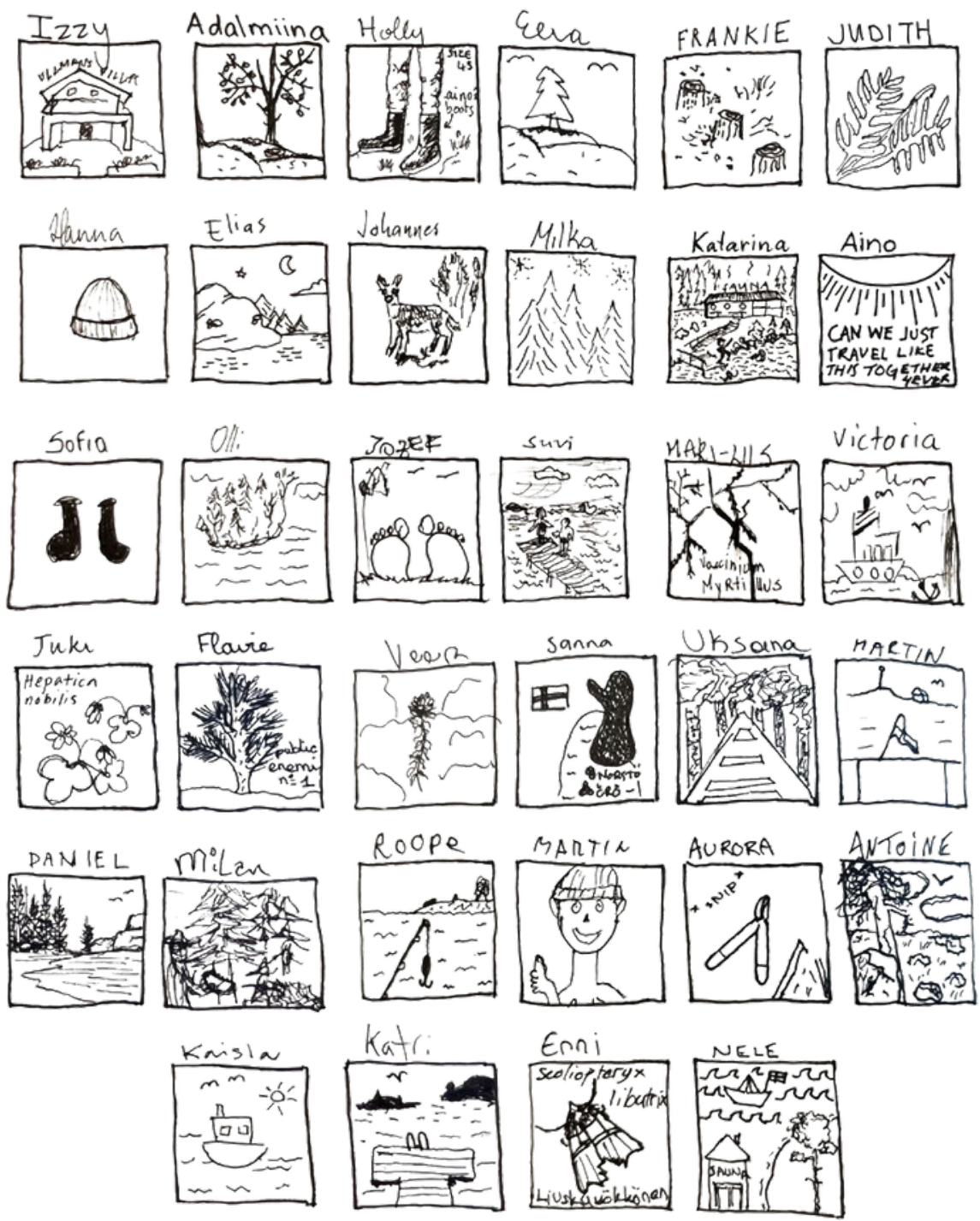
Observatietekeningen door participanten tijdens het natuurherstelkamp in Finland