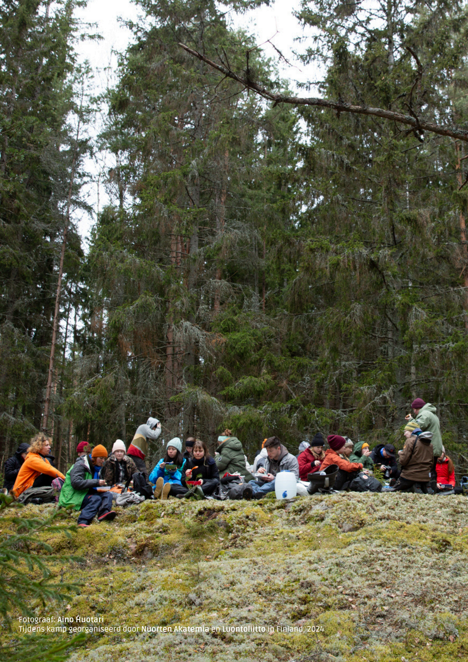
Tijdens kamp georganiseerd door Nuorten Akatemia en Luontoliitto in Finland, 2024