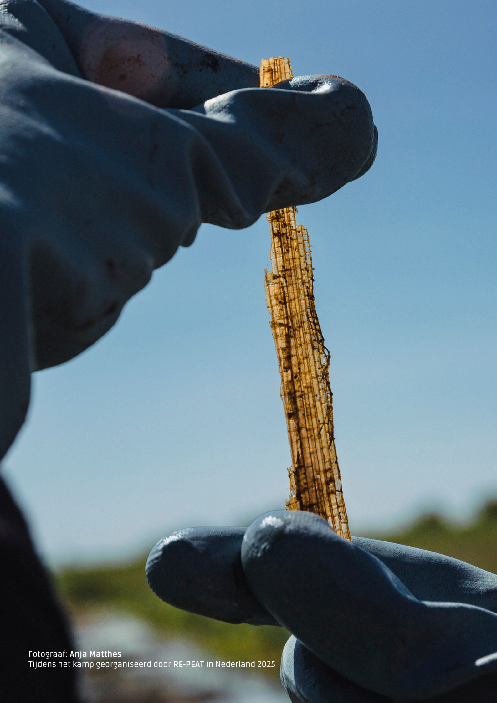
Tijdens het kamp georganiseerd door RE-PEAT in Nederland 2025