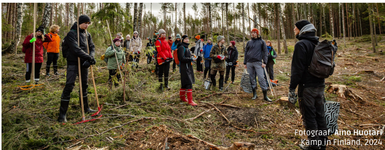
Kamp in Finland, 2024