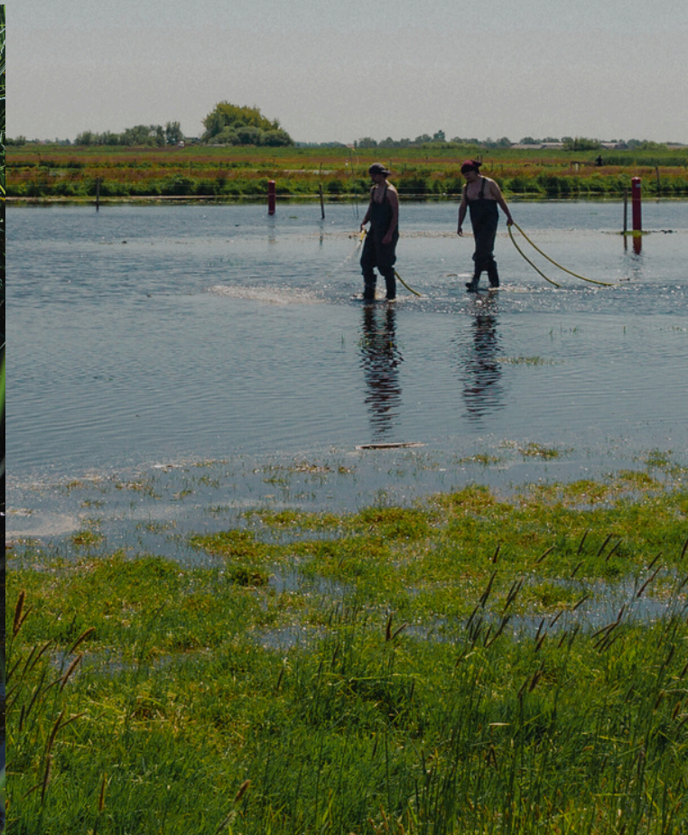
Kamp georganiseerd door RE-PEAT bij een paludicultuur boerderij in Nederland, 2025