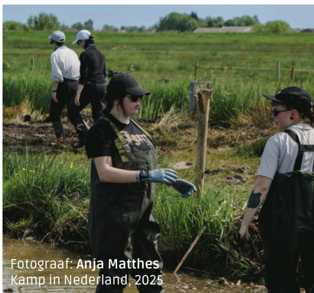
Kamp in Nederland, 2025