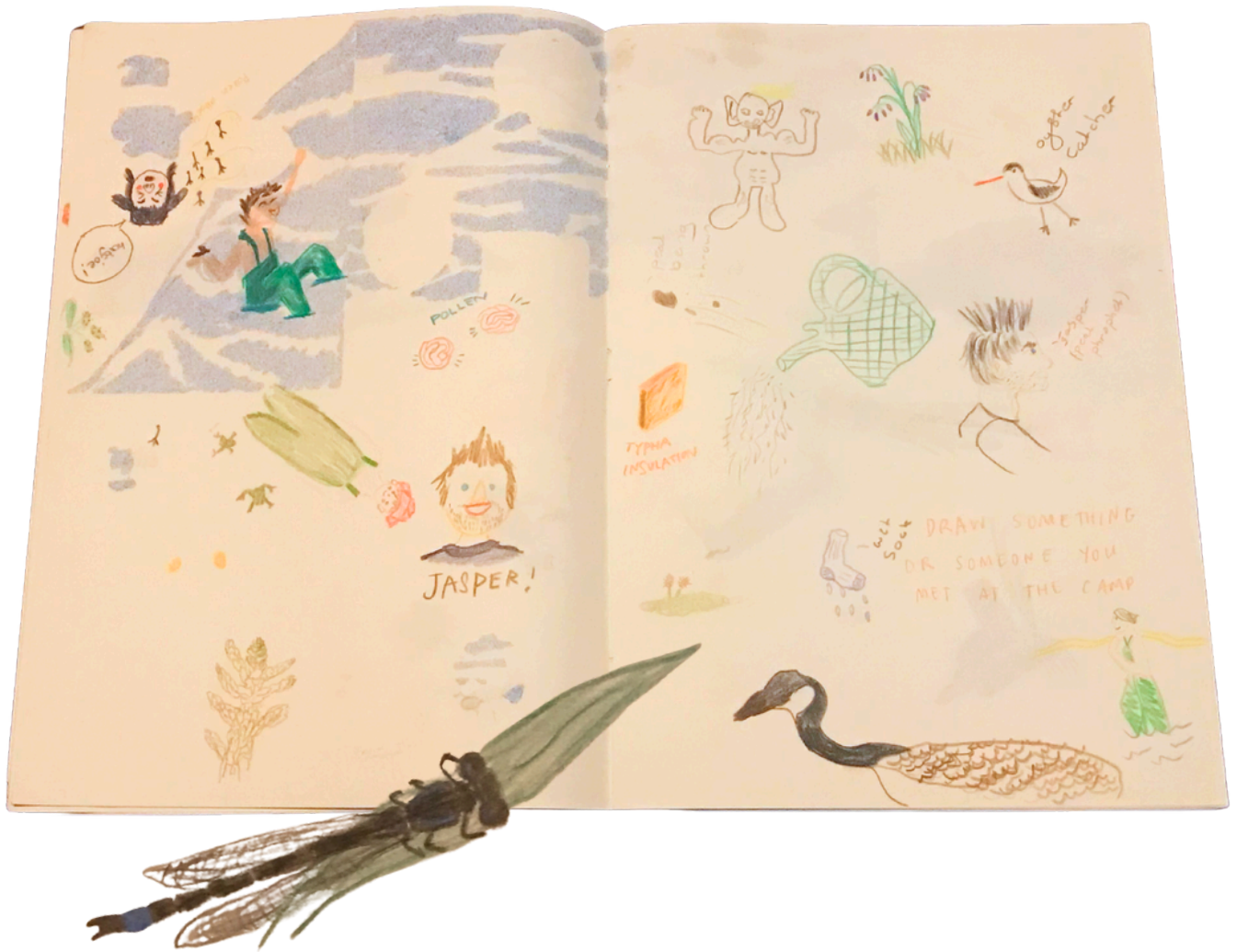
Observatietekeningen door participanten tijdens het Nederlandse natuurherstelkamp.