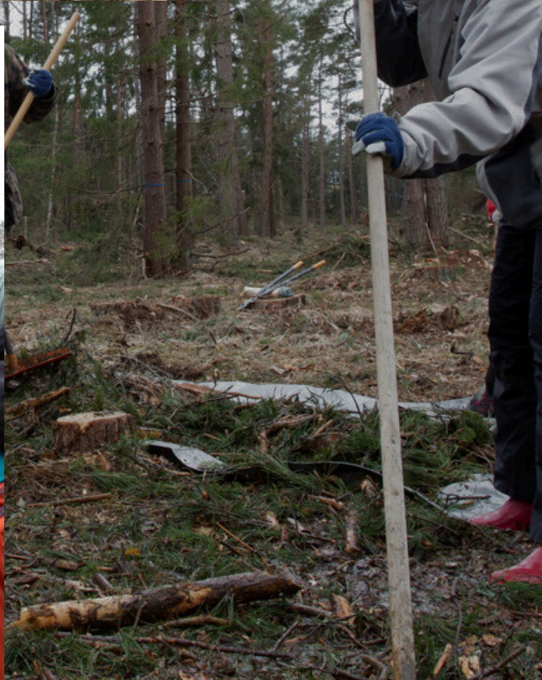
Tábor organizovaný organizáciami Luontoliitto a Nuorten Akatemia na ostrovoch Öro and Norstö vo Fínsku, 2024.