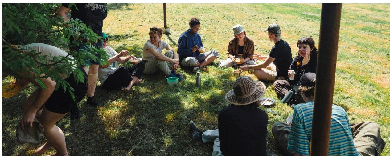
tábor v Holandsku, 2025

Odporúča sa zakončiť deň spoločnou reflexiou. Môže mať formu krátkej skupinovej diskusie alebo individuálneho zápisu do denníka. Je to príležitosť zdieľať čo sa účastníci naučili, ako deň prežívali, čo by sa dalo nabudúce zlepšiť. Reflexia pomáha upevniť učenie a zároveň posilňuje skupinový zážitok.