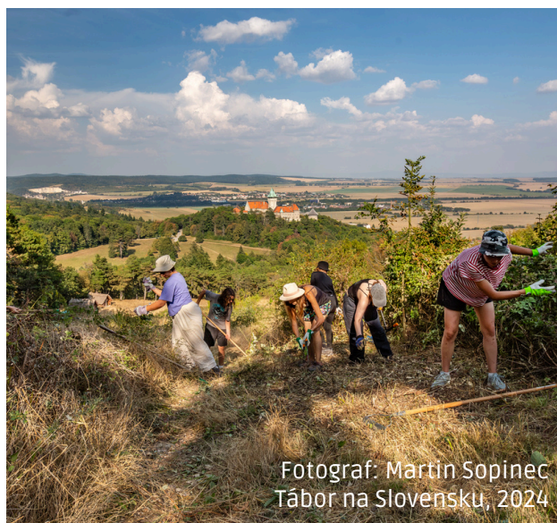
Tábor na Slovensku, 2024