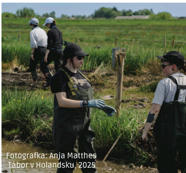
Tábor v Holandsku, 2025