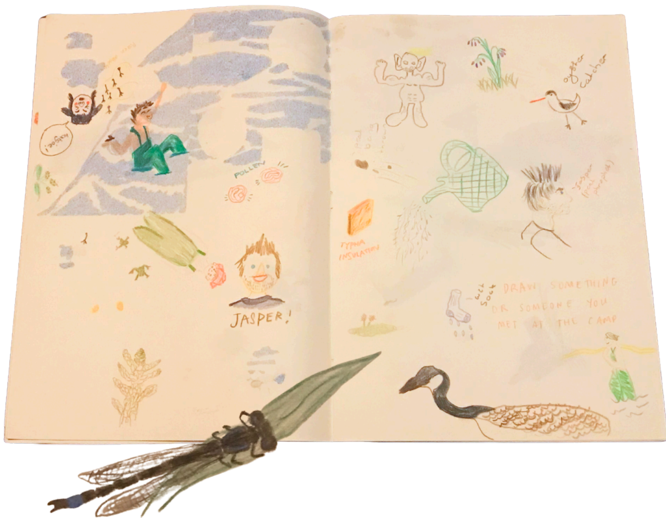
Pozorovacia kresba účastníkov počas tábora obnovy prírody v Holandsku.