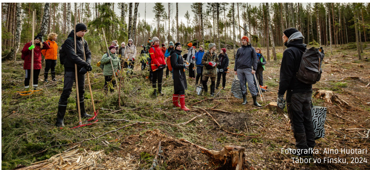
Tábor vo Fínsku, 2024