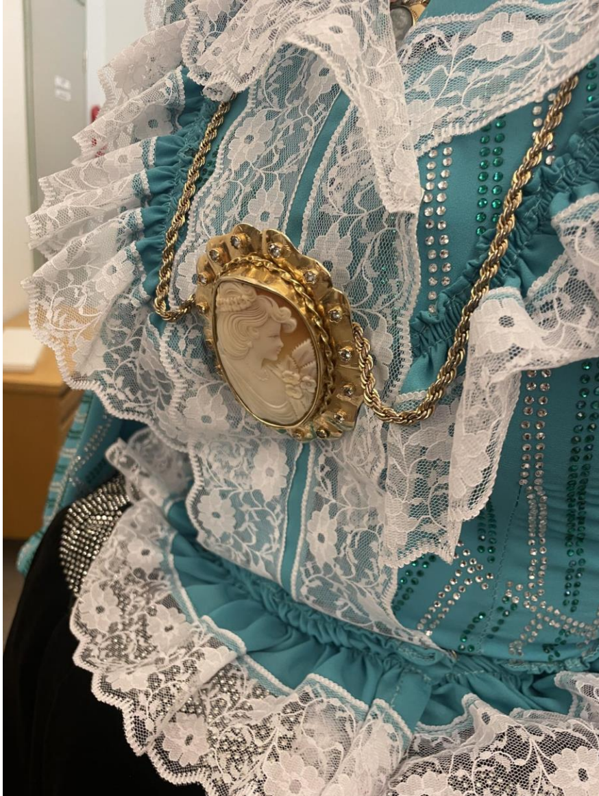
Kuva: Carmen Valerius