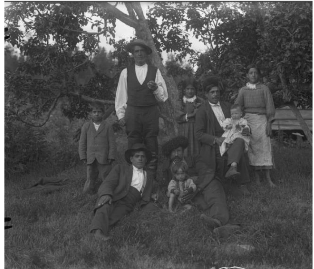
Kuva: Matti Luhtala, 1918, Museokeskus Vapriikki